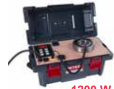
Riscaldatore portatile Betex 24 XLDi