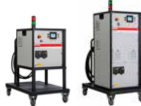
Betex MF Quick Heaters montaggio e smontaggio