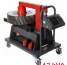
Betex 40 RMD TURBO