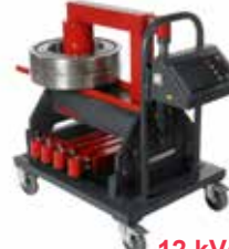
Betex 38 ZFD