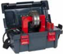
Betex 22 ELDi