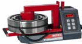
Betex 24 RLDi TURBO