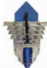
Betex 54 estrattori per interno e sterno