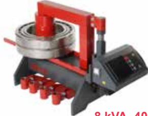
Betex 40 RSD TURBO