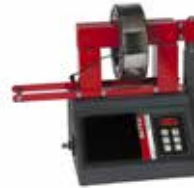
Betex 22 ESDi