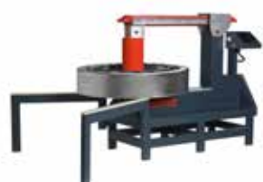
Betex Super/Giant TURBO