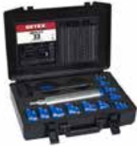
Fitting tool set Impact 33/39