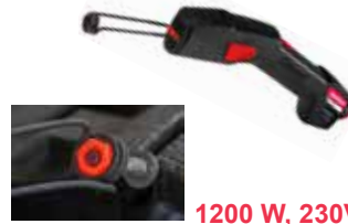
Riscaldatore a induzione manuale Betex iDuctor