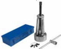
Betex 56 estrattore per interni