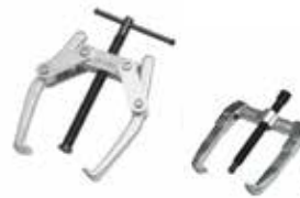
Betex 46/47 estrattore per esterno