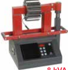
Betex 38 ESD