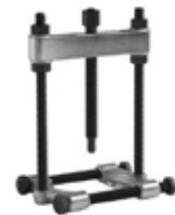
Betex 48/49 estrattore in due metà per cuscinetti