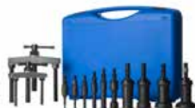
Betex 62 estrattore per interni